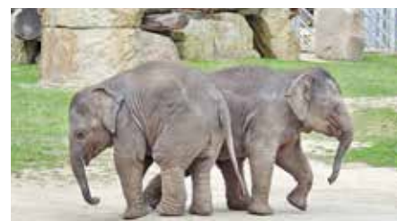
Zrcadlení, autor: Kateřina Tahalová, kategorie: Fotí děti – Sloní princezny, 1. místo

Bližší informace získáte na tel. 296 112 111, pr@zoopraha.cz , www.zoopraha.cz , www.facebook.com/zoopraha .