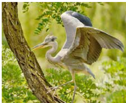
Tančící volavka, autor: Michaela Přichystalová, kategorie: Fotí dospělí – Příroda v Zoo Praha, 1. místo

Letos se v soutěži Fotím v Zoo Praha sešlo celkem 486 fotografií, do semifinále pak díky hlasování veřejnosti postoupilo 88 z nich. Největší zastoupení měla osvědčená podkategorie Příroda v Zoo Praha – volně žijící živočichové a flóra (180 zaslaných snímků), nezaostávala ovšem ani nová témata Sloní princezny (164 snímků) a Darwinův kráter (142 snímků). Děkujeme všem, kdo se zapojili do letošního hlasování, které bylo z velké části on-line a v němž jsme zaznamenali téměř 6 000 lajků. Více najdete na stránkách zoo. Tady je malá ochutnávka: