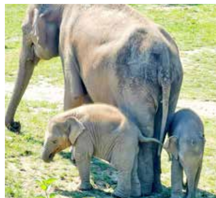
Pořád spolu, autor: Jaroslav Kroh, kategorie: Foceno mobilem – Sloní princezny, 1. místo