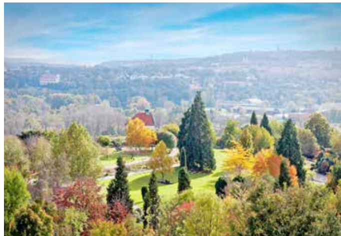
ZK FOTO: ARCHIV BOTANICKÉ ZAHRADY HL. M. PRAHY

Botanická zahrada má své kouzlo v každém ročním období. Rozkládá se na ploše zhruba sedmdesáti hektarů, na kterých má návštěvníkům určitě co nabídnout. Dopravit se tam můžete autobusem, přívozem, od dubna do října parníkem i autem. K dispozici je placené nehlídané parkoviště i možnost občerstvení. Nejznámějším místem botanické zahrady je bezesporu skleník Fata Morgana, ale patří k ní i úžasná venkovní expozice a pozor – také vinice s celoročně otevře-