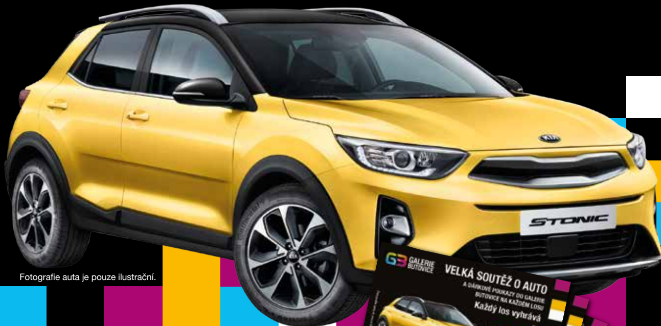
Fotografie auta je pouze ilustrační.