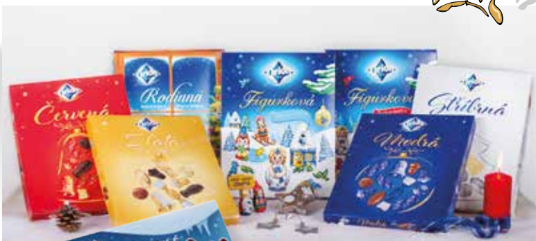
2015 - Je bezpočet hvězd, ale jen jedna je čokoládová