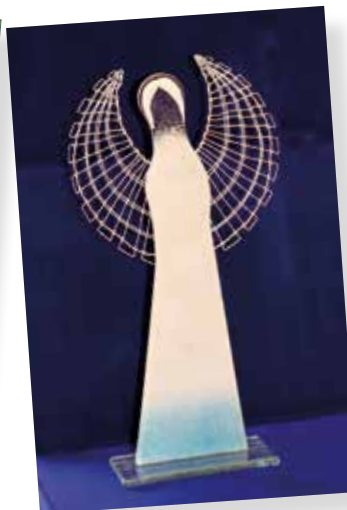
2019 - Jemná krása krajky