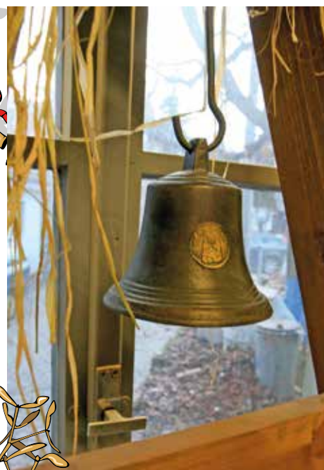
2010 - Zvony k nám promlouvají v den všední i nevšední