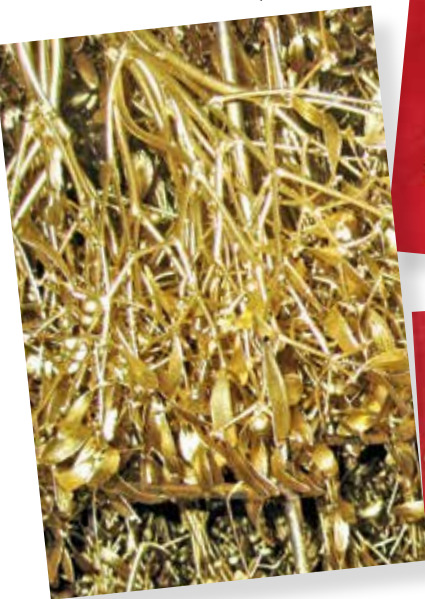
2014 - Padesát tun štěstí a lásky