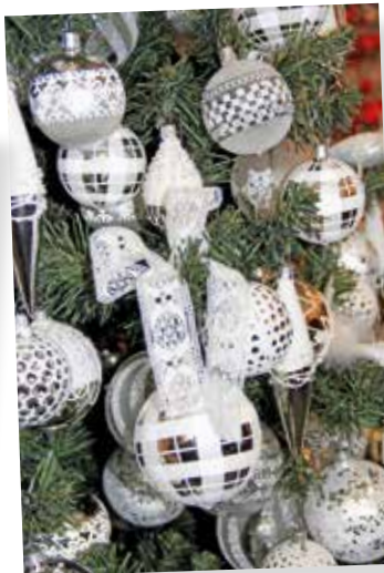
2017 - Vánoční ozdoby s duší a srdcem malířů a sklářů