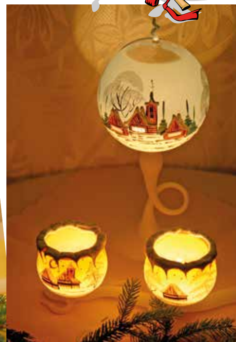
2009 - Křehké kouzlo Vánoc