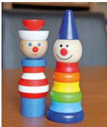
2016 - Dřevěná hračka - cesta z lesa pod stromeček