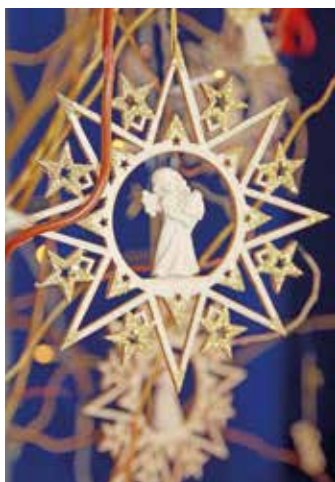
2018 - Betlémy a vánoční ozdoby, které obdivuje celý svět