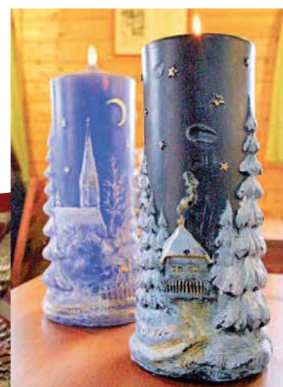
2011 - Voňavé království svíček