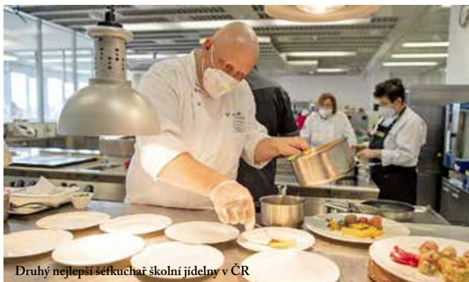
Druhý nejlepší šéfkuchař školní jídelny v ČR