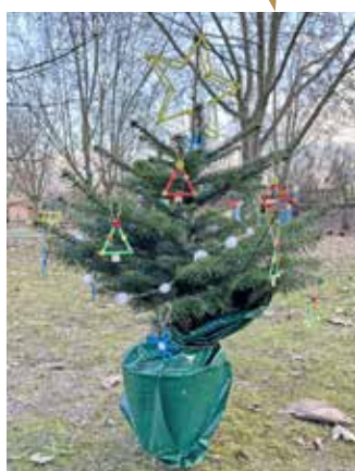
MŠ SLUNÍČKO POD STŘECHOU