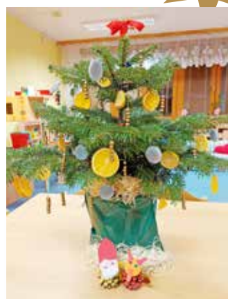
MŠ U RUMCAJSE