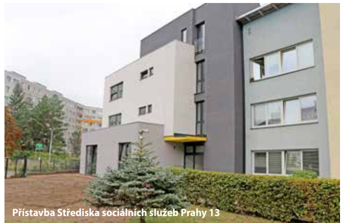
Přístavba Střediska sociálních služeb Praha 13

V areálu Střediska sociálních služeb byla dokončena přístavba nového čtyřpodlažního objektu. Vznikl zde nový prostor pro deset malometrážních bytů určených pro seniory v tíživé životní situaci,