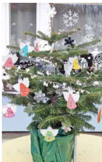
MŠ U ÚSMĚV