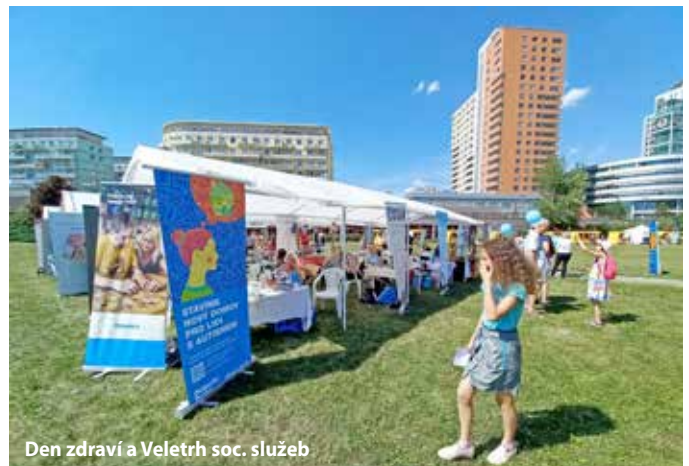
Den zdraví a Veletrh soc. služeb

Pro širokou veřejnost se opět uskutečnilo několik preventivních a osvětových akcí, například Den zdraví a Veletrh sociálních služeb Praha 13. Tato akce každoročně přiláká stovky zájemců o informace a desítky organizací, které poskytují své služby v naší městské části zde prezentují své služby. Velký zájem vzbudila také Bezpečná třináctka, kde se v rekordním zastoupení prezentovaly složky Integrovaného záchranného systému přímo na Slunečním náměstí.