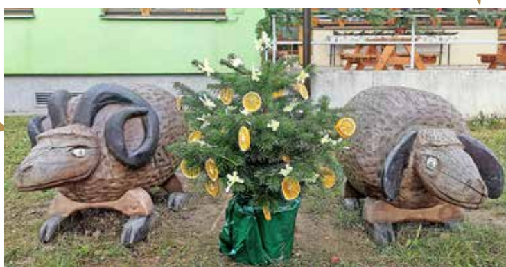
MŠ OVČÍ HÁJEK