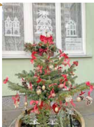
MŠ U BOBŘÍKA