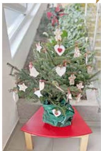
MŠ U STROMU