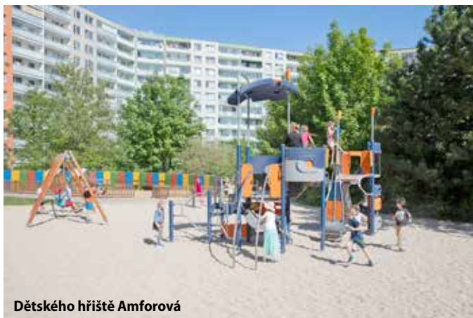
Dětského hřiště Amforová

Intenzivně řešíme i navýšení kapacity parkovacích míst. Probíhá výstavba nového P+R parkovacího domu v Petrážkové ulici, který pomůže navýšit parkovací kapacity Novým Butovicím. Zároveň jsme zahájili přípravné a projektové práce na dalších parkovacích domech. Zcela novým projektem loňského roku je komunitní zahrada na Velké Ohradě. Od června se na pozemku u základní školy upravoval terén, musela se navázat vhodná půda, vystavět zpevněné chodníky a nakonec došlo na výsadbu stromů, keřů a vybudování skladu nářadí. Současně jsme také intenzivně komunikovali se vznikající komunitou, která bude zahradu využívat, provozovat, a hlavně nadále rozvíjet. Zájem veřejnosti o komunitní zahradničení nás velmi těší a věřím, že první komunitní zahrada v naší městské části bude úspěšně fungovat.