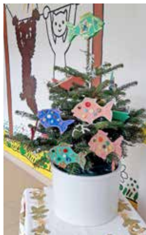
MŠ BĚHOUNKOVA 2300