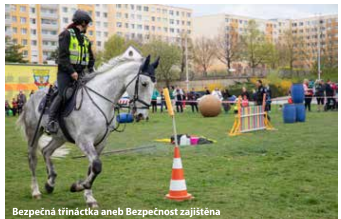
Bezpečná třináctka aneb Bezpečnost zajištěna