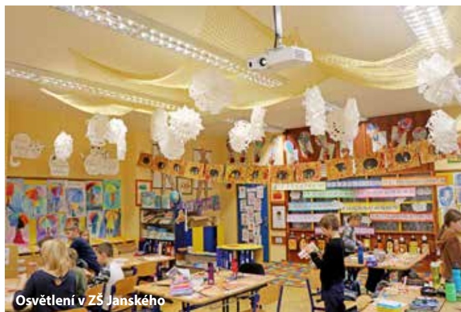
Osvětlení v ZŠ Janského

Vážím si mnohých ocenění, které naše školy během minulého roku získaly. Školství v naší městské části je jedním z nejlepších v Praze a děti zde mají výborné zázemí i ve volnočasových aktivitách.