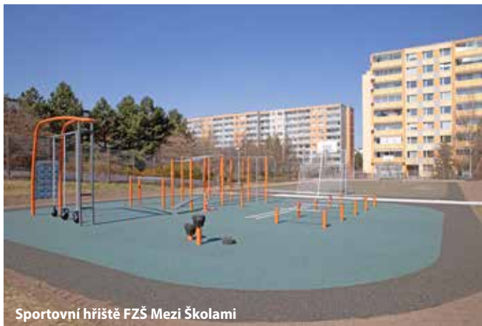
Sportovní hřiště FZŠ Mezi Školami

I za těchto nepředvídatelných situací úřad naší městské části své služby klientům a obyvatelům poskytoval v plné míře a podařilo se mnoho skvělých projektů.