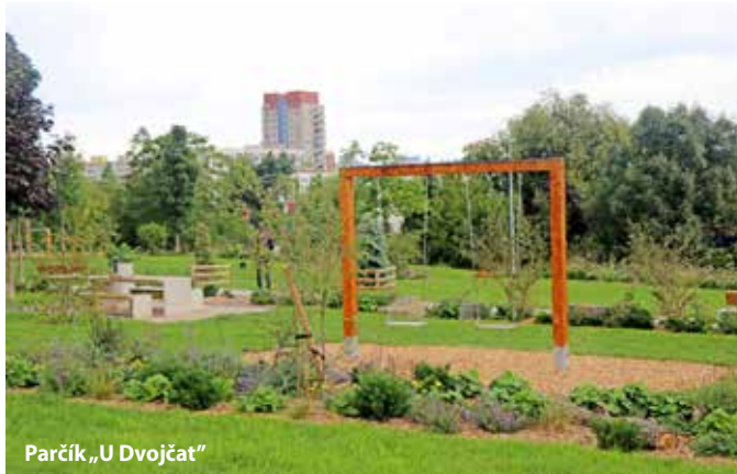
Parčík „U Dvojčat“

V létě byla dokončena úprava parku „U dvojčat“ v ulici Tlumačovská. Po terénních úpravách, výsadbě nových stromů, keřů, květin a instalaci mobiliáře, získal zcela novou podobu. Mezi kvetoucími pásy jsou umístěny lavičky, posezení se šachovnicí, houpačky a ne-